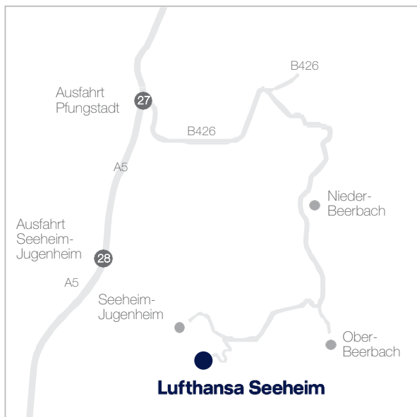
Umleitungsstrecke / Deviation route